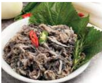
오독거리는 특유의 식감과 감칠맛으로 인기가 있는 천엽! 코리코리한 독특한齒たえや 食感とコクのある旨さの千枚!