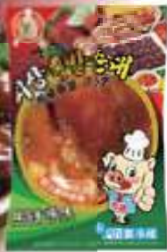
시장 왕족발 市場豚足(大)

豚足は、お肌の老化防止に効果のあるコラーゲンと保湿効果で注目を集めるヒアルロン酸がたっぷり!