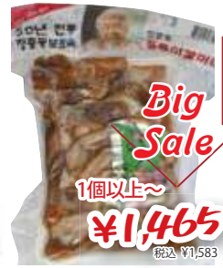
장충동 슬라이스 족발 匠忠洞豚足(スライス)