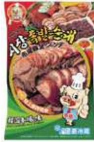
시장왕 슬라이스족발 市場豚足(スライス)