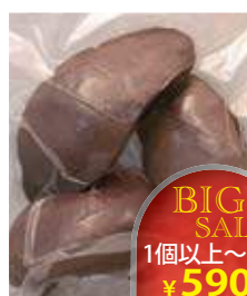
삼은 돼지간 豚レバー(ポイル)