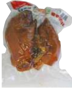
장충동 족발 (소) 匠忠洞豚足(小)