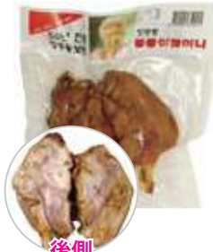
장충동 족발 절반 컷팅 匠忠洞豚足半分切り