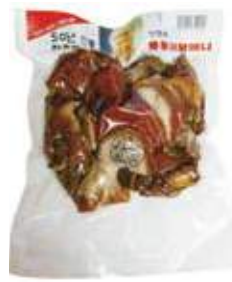
장충동 슬라이스 족발 匠忠洞豚足(スライス)