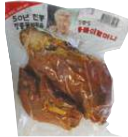
장충동 왕족발 (대) 匠忠洞豚足(大)