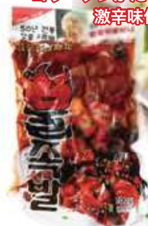
장충동 불족발 匠忠洞激辛豚足