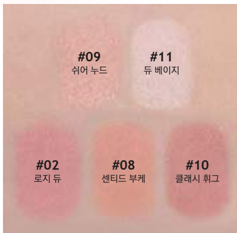
#09 쉬어 누드