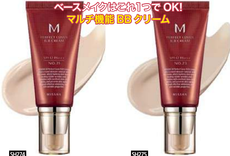
SH274 21호 라이트 베이지 / 21号 라이트베ージュ

シミ・ソバカスをつくる 紫外線UVBも、シワをつくるUVAもカット! ベースメイクはこれ1つで OK! マルチ機能 BB 크림