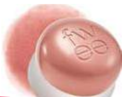
HB447 ND04 마이 마이