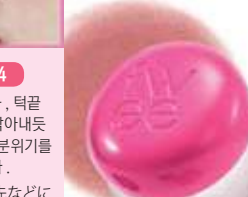
HB449 PK02 스커트 스커트