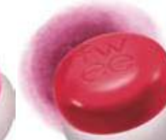
HB450 RD05 그리디 그리디