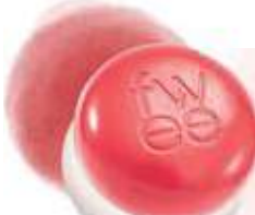
HB448 CR02 보이 보이