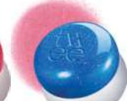
HB451 BS03 버블 바블

ふわっふわっ新概念 ブラーリープリンテクス チャーが唇のしわを さっと埋めてなめらかに! リップからチークまで 指一本でさらっと染める!